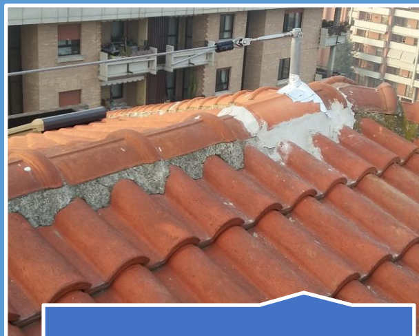
Installazione linea vita