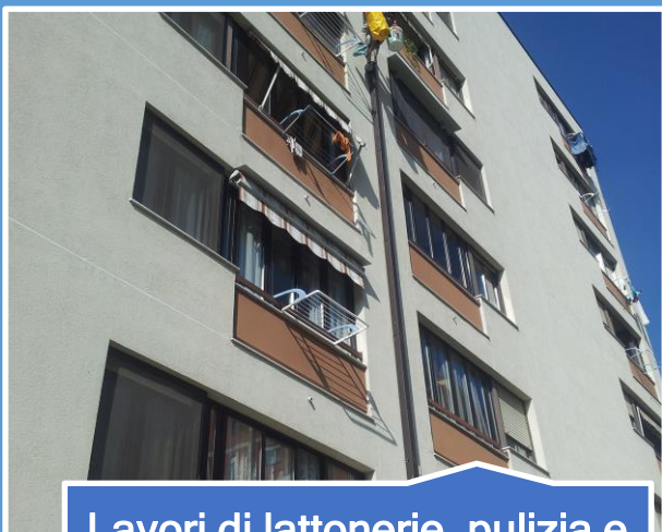
Lavori di lattonerie, pulizia e riparazione gronde. Montaggio dissuasori volatili